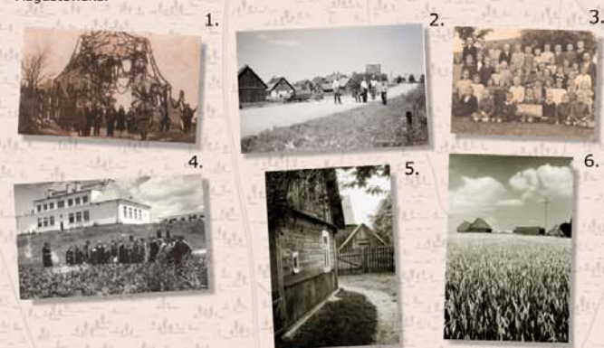
1. Brama powiatowa w Gibach przygotowana z okazji wizytacji wojewody białostockiego, 1931 rok 2. Żołnierze niemieccy w Gibach, okres II wojny światowej 3. Młodzież, nauczyciele i rodzice Publicznej Szkoły Powszechnej II stopnia w Gibach, po 1945 roku 4. Lekcja biologii przed szkołą w Gibach, lata 60. XX wieku 5-6. Giby 1976 rok.

Ogromne straty przyniosła na terenie gminy II wojna światowa oraz przeprowadzona przez oddziały sowieckie, już po jej zakończeniu, w lipcu 1945 roku Obława Augustowska.